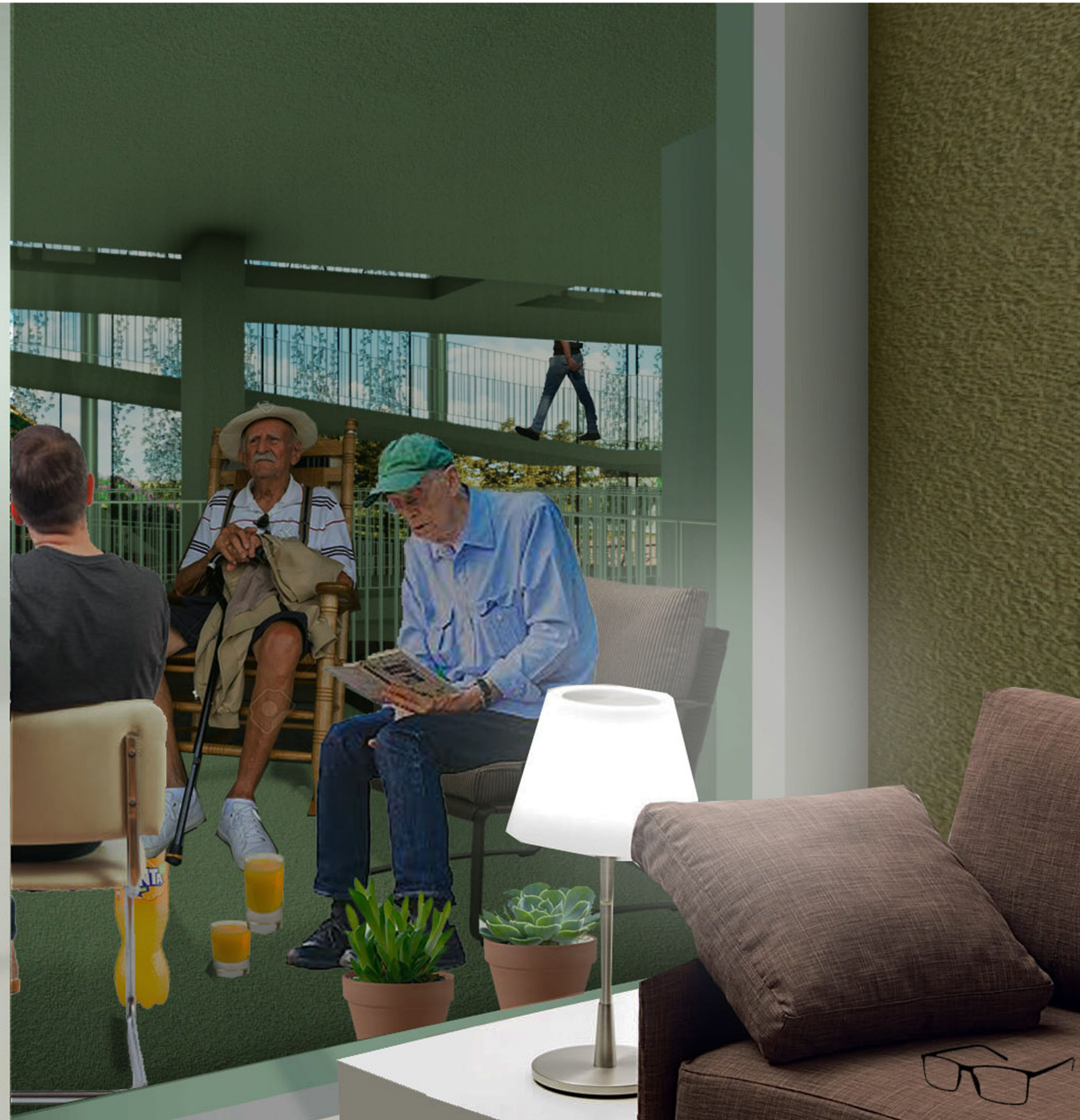
AMBITO DEL VIVERE - VISTA INTERNA HOUSING SOCIALE - FRAGILI